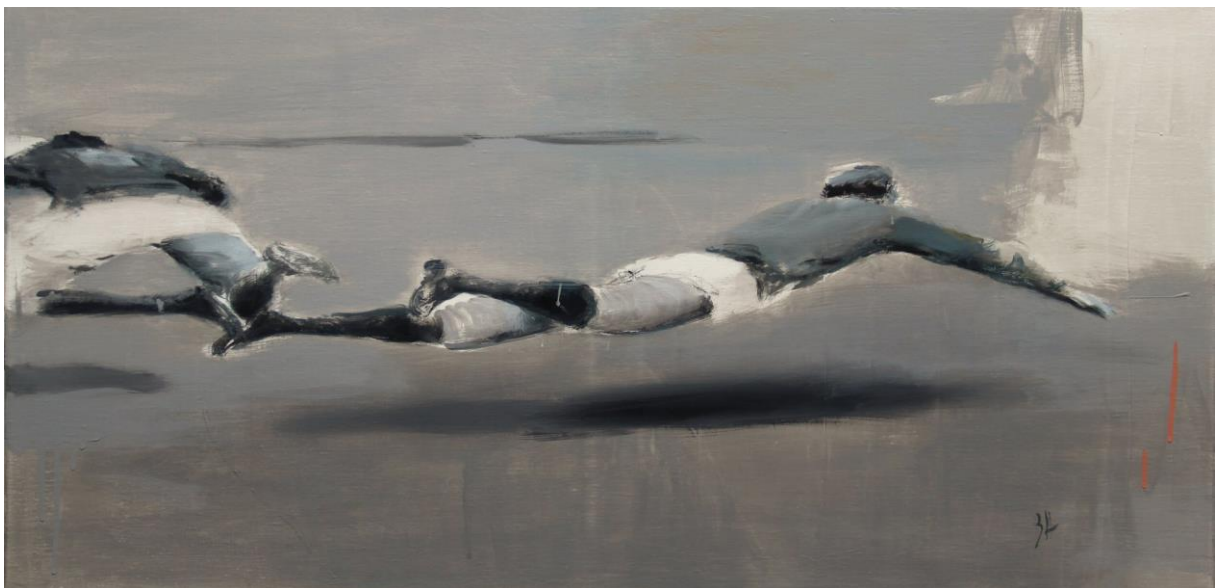
«Цяперашняе працягнутае 2»

Для жывапіснага медыя такі прыём даволі арыгінальны. Класічны мастак-жывапісец шыфруе ў творы некалькі часавых пластоў, праз якія можна прачытаць пачатак сюжэта – і знайсці намёк на яго развіццё. Рэзкае адсяканне гэтых плоскасцей набліжае жывапіс да фатаграфіі – як да медыума. Фіксуе аптычнае нейсвядомленае, злоўленае ў момант здымкі і знойдзенае пры прачытанні фатаграфіі.