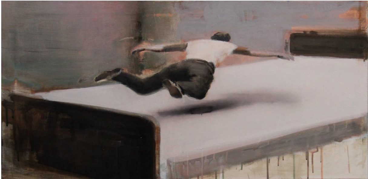
«Цяперашняе працягнутае 9»

І другі прыём праекта «Present Continuous» – імітацыя фатаграфічных негатываў. Тады постаці цалкам вызваляюцца ад рэальнасці і пачынаюць існаваць толькі як магчымасці. Зусім як у класічнай фатаграфіі, што валодае здольнасцю фіксаваць формы рэальнага жыцця з дапамогай святла і раскрываць іх сродкамі хімічных рэактываў.