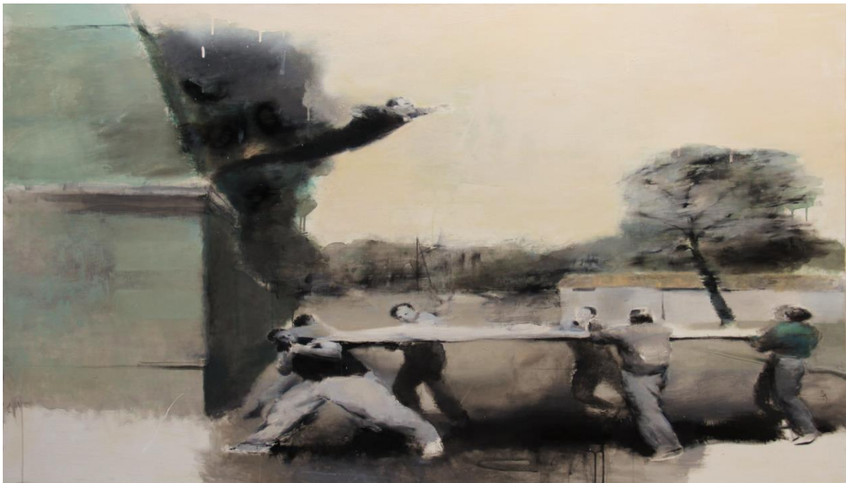
«Скачок у пустэчу 1»

Нібы папкі навукоўца, шчыльна запоўненыя тэкстам, так і карціны Наталлі Залознай становяцца паверхняй, на якой мастачка фіксуе сляды сваіх ментальных і фізічных эксперыментаў. Палотны класіфікуюцца, надзяляюцца подпісамі і часам нават нумарамі, праекты суправаджаюцца навуковым апісаннем. Аднак, нягледзячы на яўныя канцэптэуальныя рамкі, выявы Наталлі Залознай апелююць да эмоцый. Жывапіс мастачкі застаецца дынамічным і жарсным, быццам фіксуюцца не парадоксы часу, а ўзнікненне новых формаў жыцця.