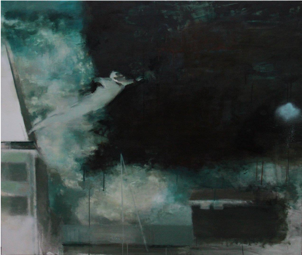
«Скачок у пустэчу 2»

«Present Continuous» 2013 года. «Цяперашняе працягнутае» – пераклад адной з формаў часу англійскай мовы здаецца ёй парадаксальнай гульнёй слоў. У тых жывапісных працах аўтарка спрабавала зафіксаваць няўстойлівы момант руху або падзення як спыненае імгненне ўнутры выпадковасці. Дзеля гэтай мэты яна імітавала сродкамі жывапісу некалькі фатаграфічных прыёмаў.